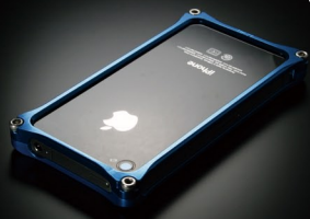
Solid Blue / ソリッドブルー 商品No:GI-202BL